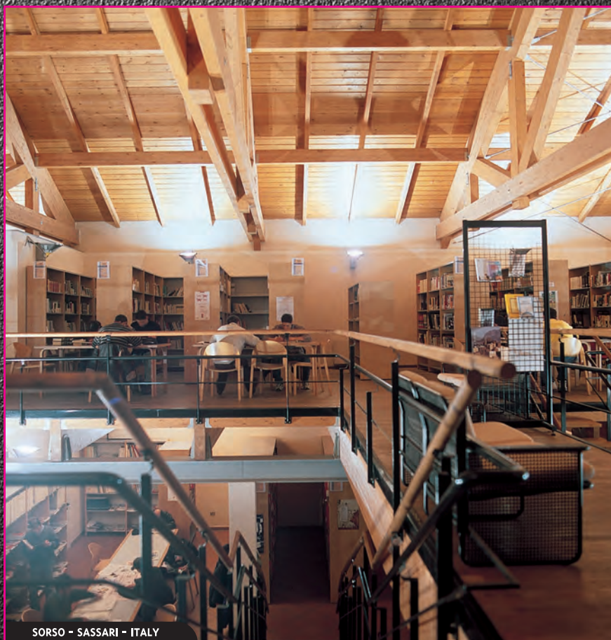
SORSO - SASSARI - ITALY

Il Centro Studi Ricerca e Produzione Gonzagarredi si occupa della progettazione ambientale per le biblioteche, si confronta e fornisce consulenze ai progettisti degli Enti, consegna chiavi in mano le migliori soluzioni d'arredo per le biblioteche di ogni titolarità. Servizi peculiari dell'azienda nei confronti del cliente sono le personalizzazioni d'ambiente e la costanza nella disponibilità agli adattamenti. Inoltre l'attenzione alla sostenibilità ambientale con l'utilizzo nelle diverse linee di produzione di materiali riciclati e riciclabili (alluminio, plastica e legno) è costantemente presente in Gonzagarredi, che si propone come azienda in continua ricerca di soluzioni ecocompatibili.