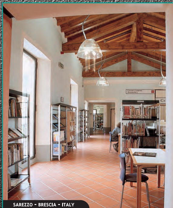
SAREZZO - BRESCIA - ITALY

La versatilità delle linee Gonzagarredi è concepita già in fase di progettazione per adattarsi alle più esigenti situazioni architettoniche. Dal disegno Hi-Tech dello scaffale in alluminio al giusto mix di legno e metallo per enfatizzare le performance dello scaffale aperto senza toglierli la possibilità di esercitare il tradizionale ruolo conservativo della biblioteca.