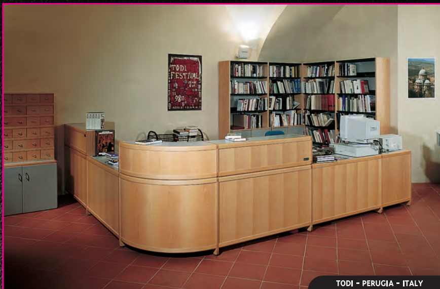
TODI - PERUGIA - ITALY

The Gonzagarredi Centre for Research and Production Studies handles environmental planning for libraries, comparable to the Authorities' planners, to whom it provides consultancy and delivering the best fittings solutions for libraries in all sectors on a turnkey basis. Special services offered by the company to the client are personalisation of the environment and a constant availability to carry out adaptations. Attention to environmental sustainability with the use of different production lines of recycled and recyclable materials (aluminium, plastic and wood) is a central tenet for Gonzagarredi, which offers its services as a company continuously searching for ecologically compatible solutions.