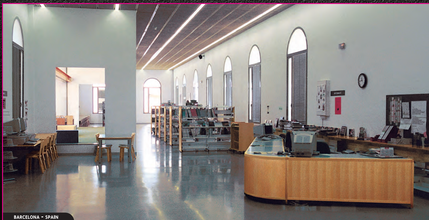
BARCELONA - SPAIN