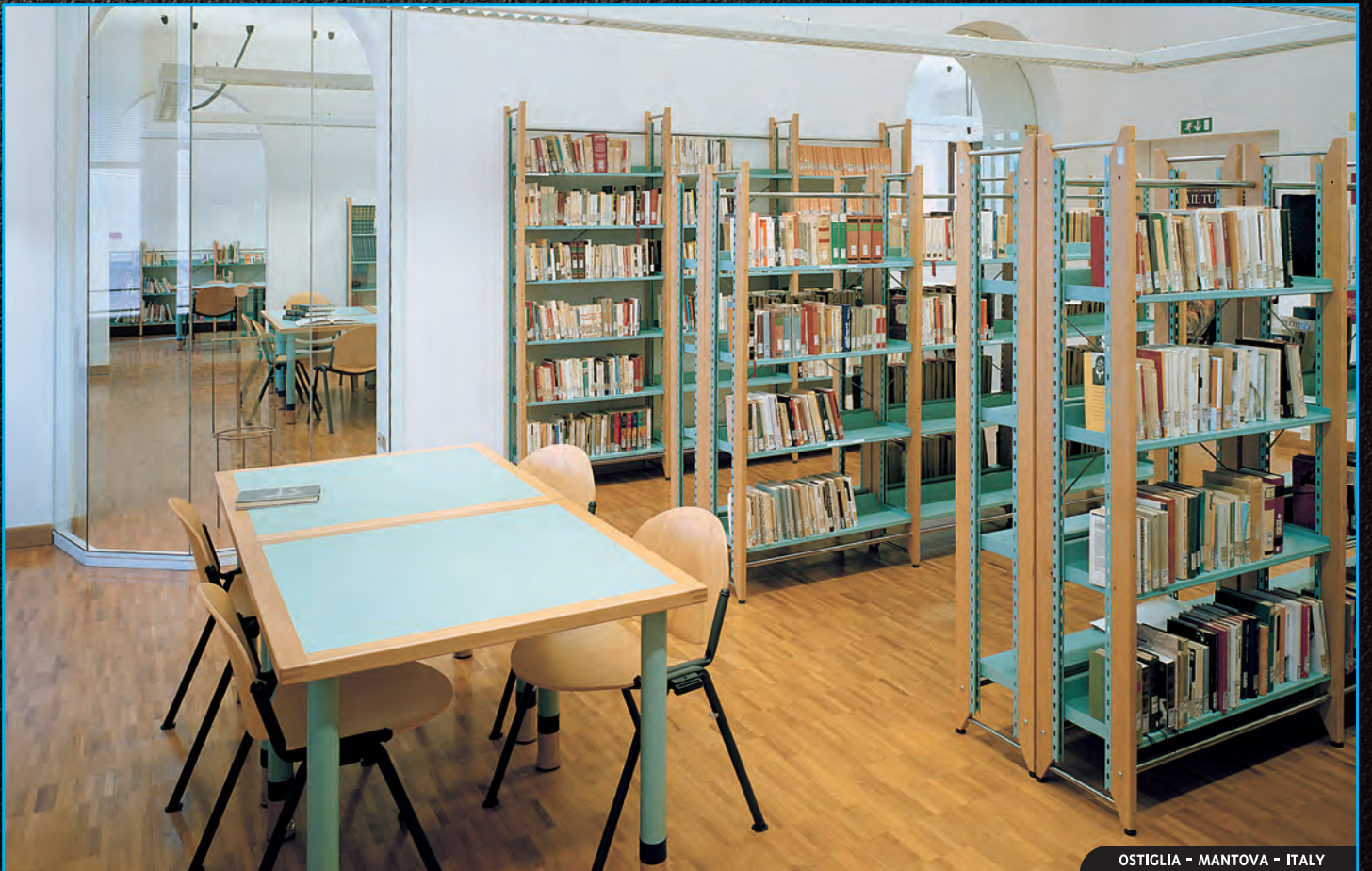
OSTIGLIA - MANTOVA - ITALY