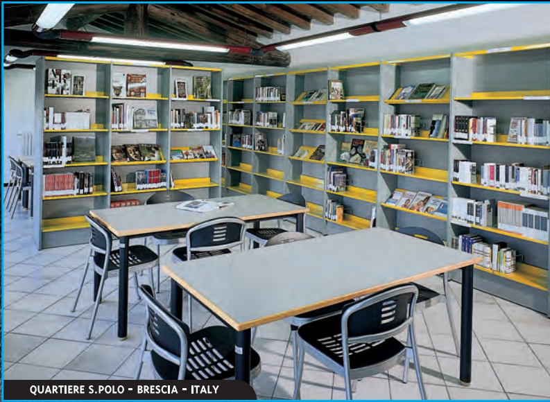
QUARTIERE S. POLO - BRESCIA - ITALY