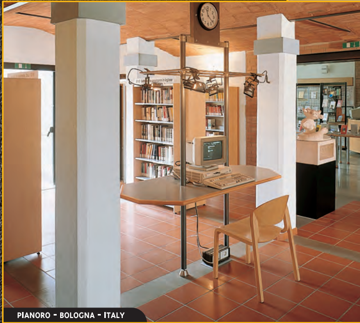
PIANORO - BOLOGNA - ITALY