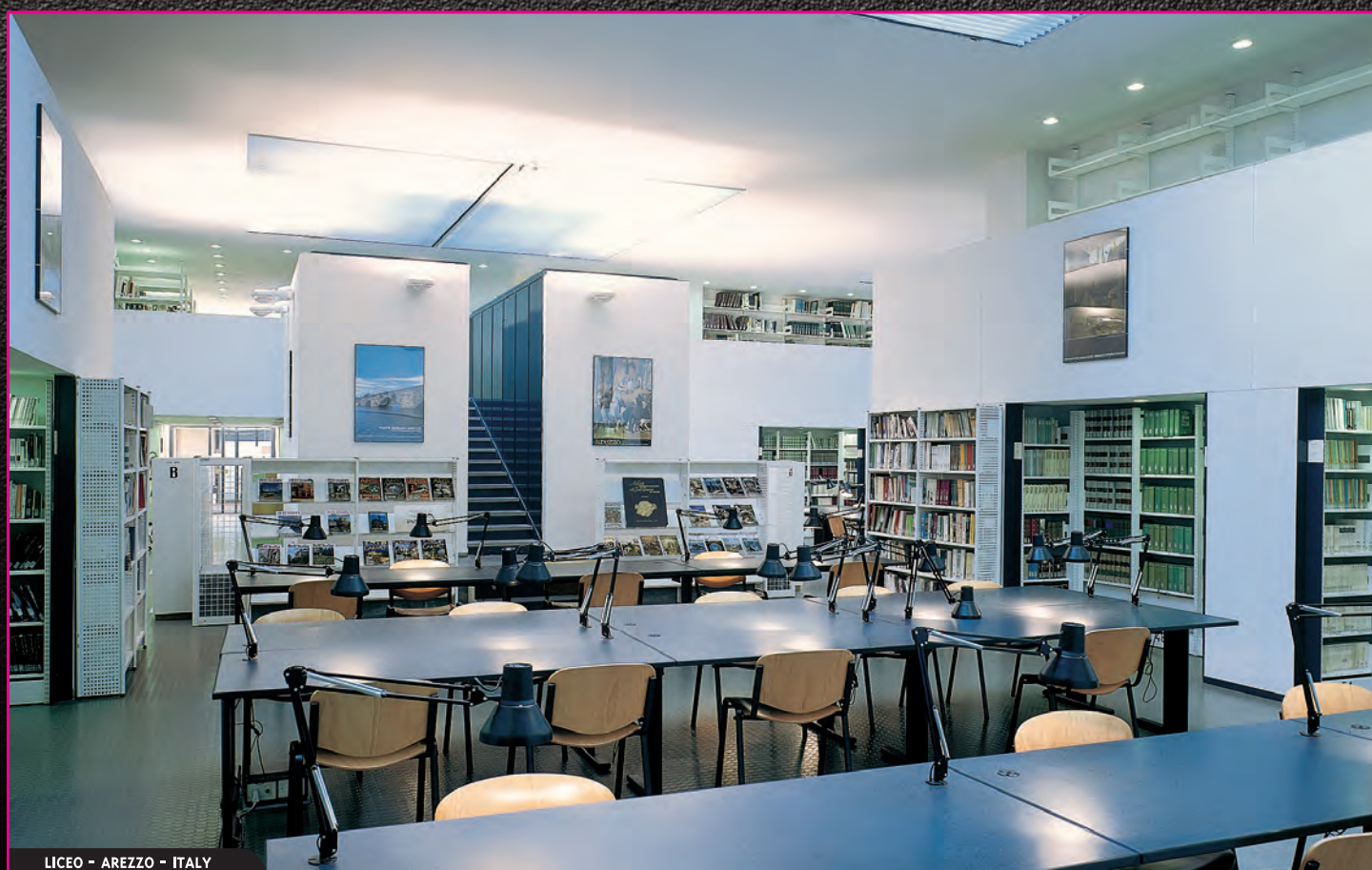
LICEO - AREZZO - ITALY