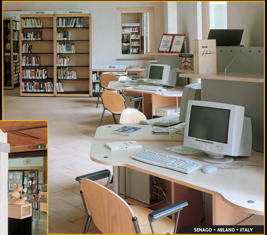
SENAGO - MILANO - ITALY