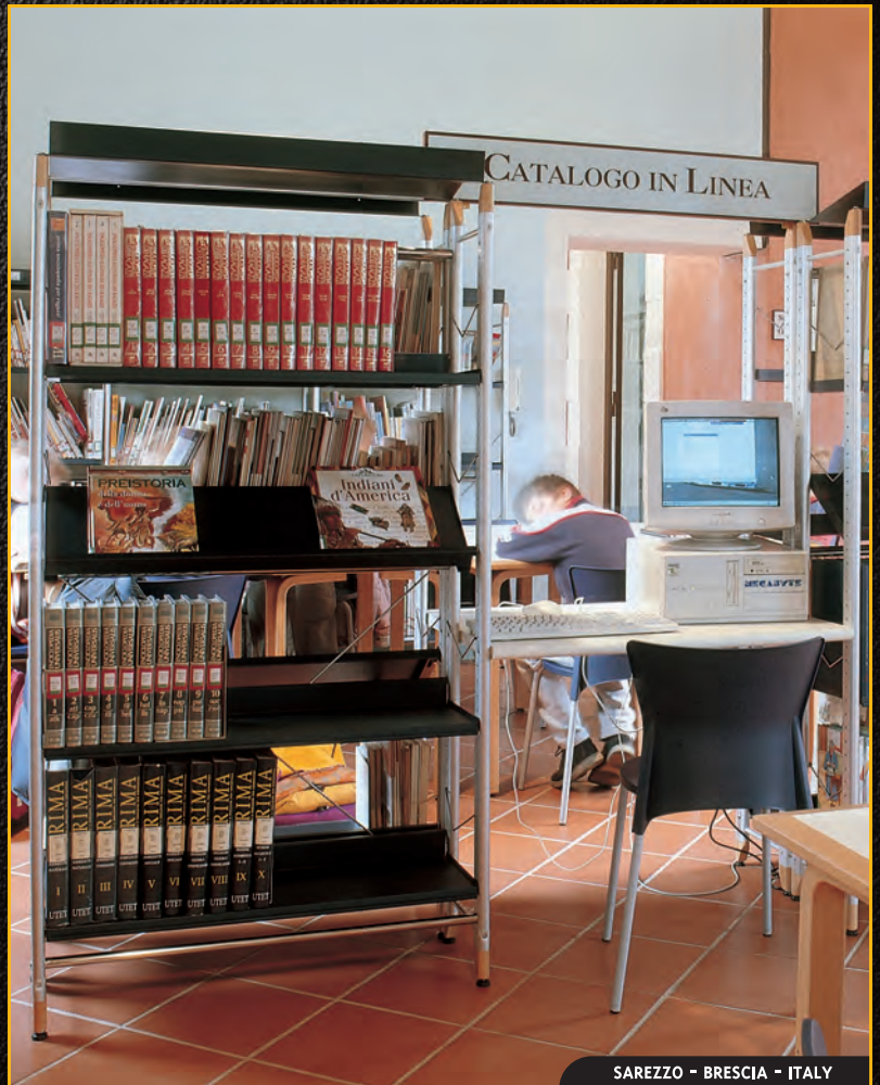
SAREZZO - BRESCIA - ITALY

Ever attentive to developments in the services provided by a library/mediatheque, Gonzagarredi produces far-sighted solutions for custom-made fittings which are designed for modification as the dictates of space and time may require.