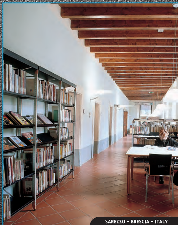
SAREZZO - BRESCIA - ITALY

N ella fase progettuale della biblioteca l'analisi degli spazi viene commisurata al movimento delle persone e degli ausili per disabili, all'ergonomia delle attrezzature funzionali alle attività di consultazione/browsing/lettura/studio e all'antropometria delle diverse tipologie di utenti, dai bambini di fascia prescolare agli adulti.