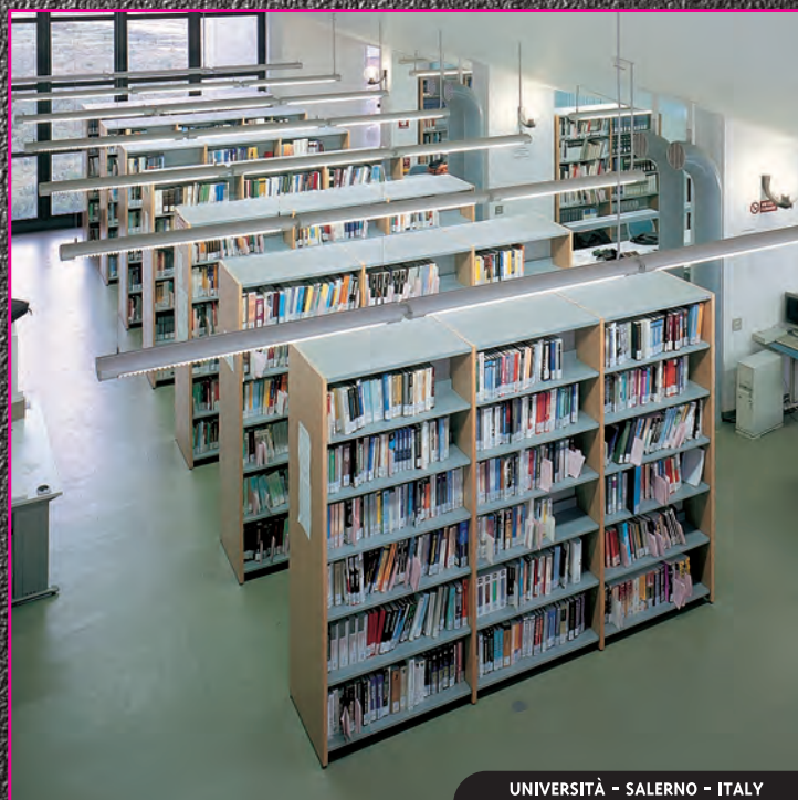
UNIVERSITÀ - SALERNO - ITALY

A nche la biblioteca universitaria, sia essa dipartimentale che di facoltà si basa sulla centralità dei bisogni culturali degli utenti, ovvero sull'accesso alla varietà di risorse informative e di studio disponibili in tempi veloci e con interfaccia amichevoli. Le nuove tecnologie si affiancano prepotentemente alle raccolte librerie tradizionali e sono soggette ad utilizzo intensivo da parte degli studenti. Per questo Gonzagarredi propone diverse linee di scaffali, tavoli, espositori e postazioni informatiche e telematiche in grado di soddisfare le richieste più specialistiche provenienti dall'ambito universitario.