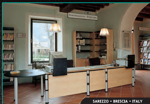
SAREZZO - BRESCIA - ITALY