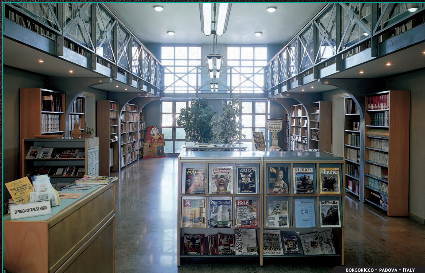
BORGORICCO - PADOVA - ITALY