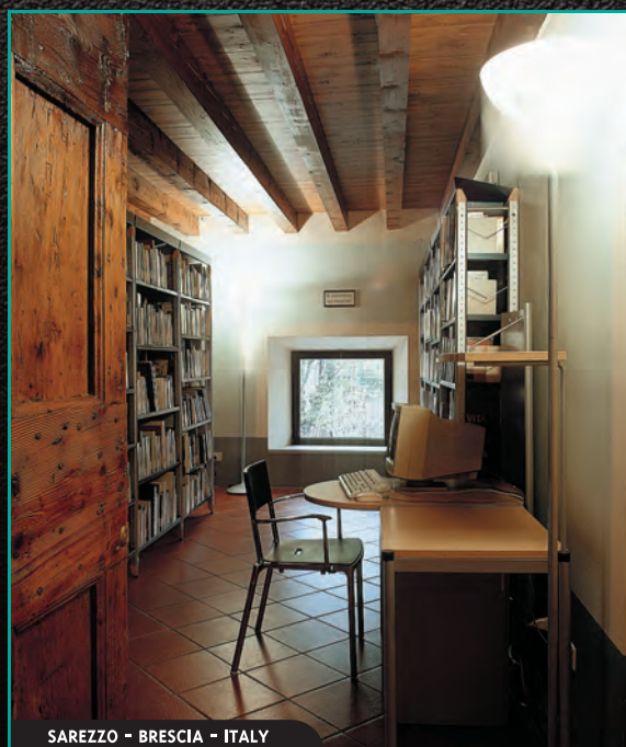
SAREZZO - BRESCIA - ITALY

La specificità del servizio di biblioteca rispetto ad altri uffici pubblici richiede, in fase di allestimento, una sinergia progettuale tra i tecnici dell'informazione e gli architetti progettisti. Il bibliotecario è in grado di trasmettere le priorità di organizzazione spaziale delle raccolte e i punti necessari di cablatura per le tecnologie innovative, anche in proiezione futura, mentre l'architetto traduce queste esigenze nella progettazione e realizzazione integrale delle diverse aree della biblioteca. Il Centro Studi Ricerca e Produzione Gonzagarredi si avvale di consulenze specifiche di architetti, ingegneri, bibliotecari, sia nella progettazione d'interni per l'applicazione degli standard di sicurezza e di ergonomia degli arredi, sia per l'aspetto biblioteconomico, al fine di rispondere adeguatamente alla complessità organizzativa della biblioteca/mediateca contemporanea.