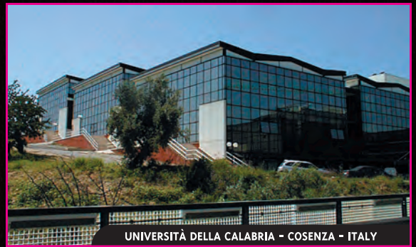
UNIVERSITÀ DELLA CALABRIA - COSENZA - ITALY