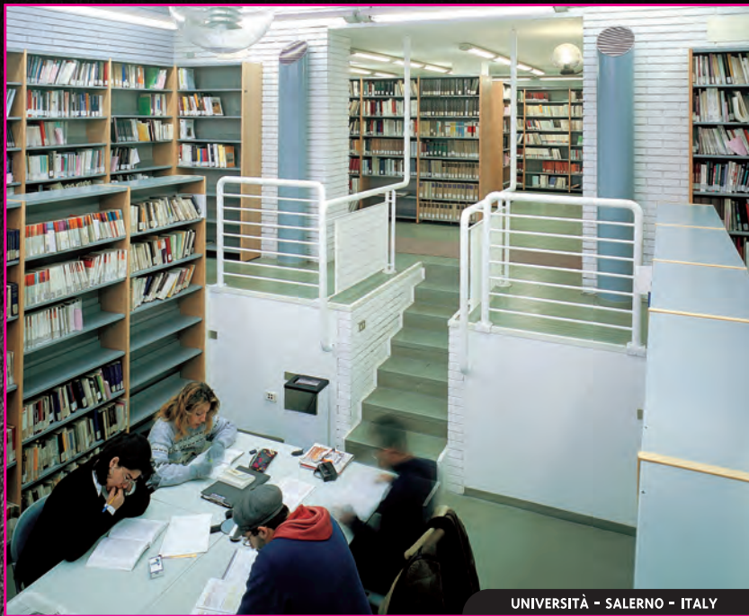
UNIVERSITÀ - SALERNO - ITALY