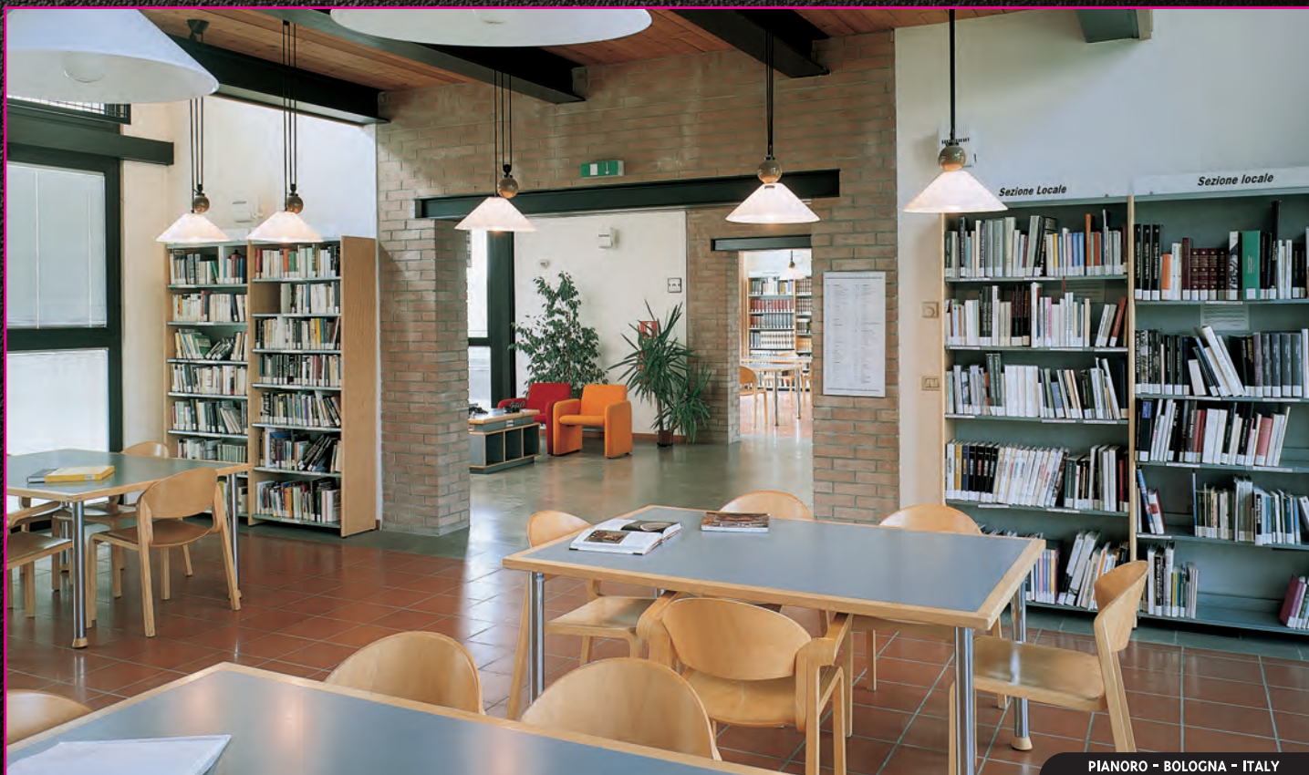
PIANORO - BOLOGNA - ITALY