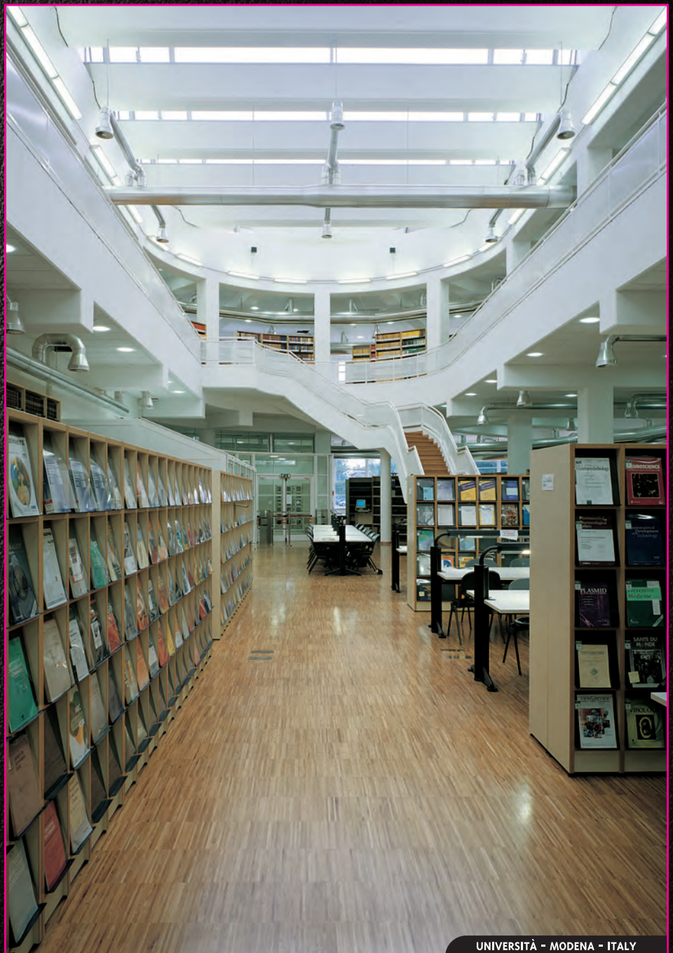
UNIVERSITÀ - MODENA - ITALY